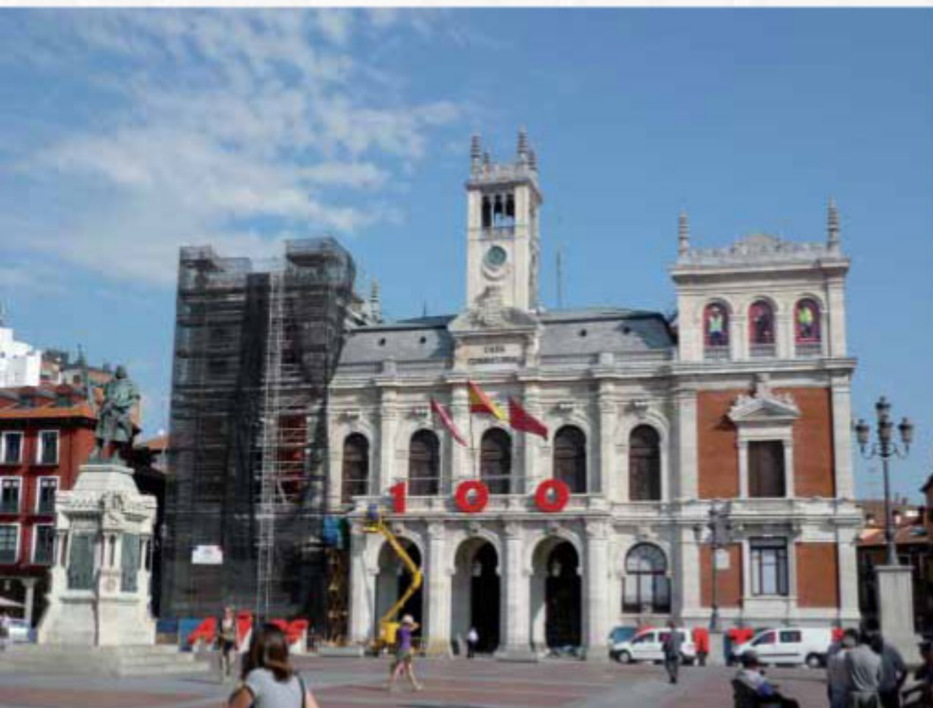
AYUNTAMIENTO DE VALLADOLID