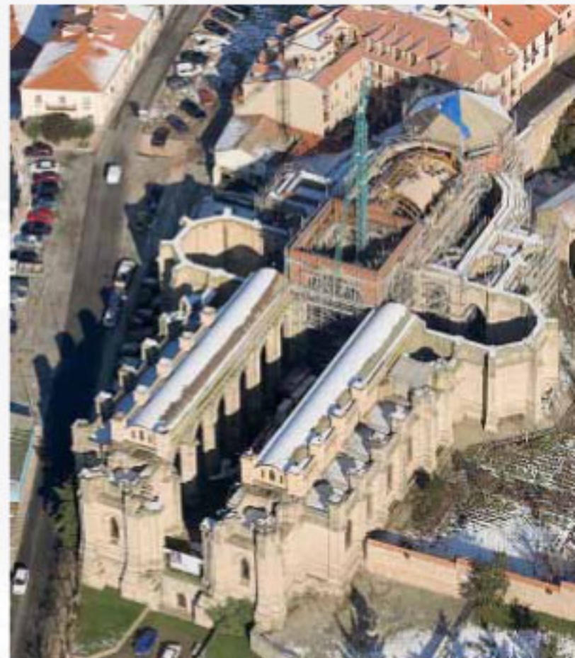
MONASTERIO DE LA VID, Burgos