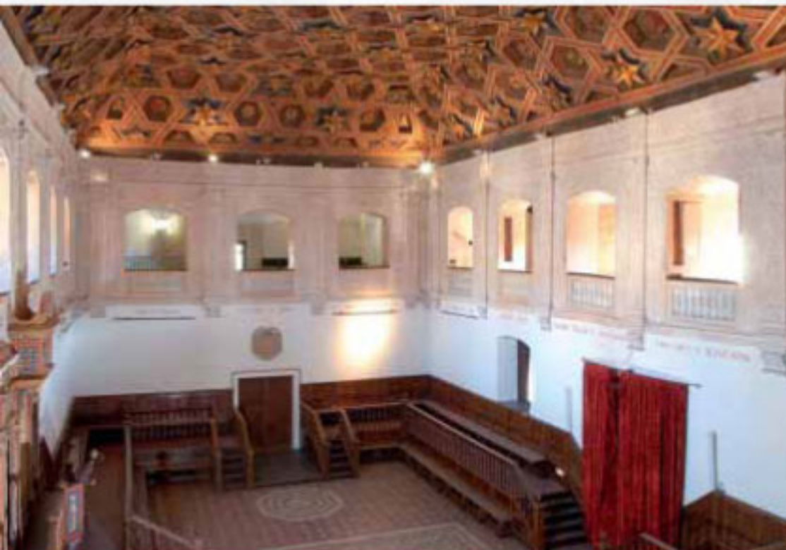
PARANINFO UNIVERSIDAD ALCALÁ DE HENARES