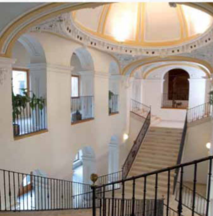
COLEGIO CARACCILO, Alcalá de Henares