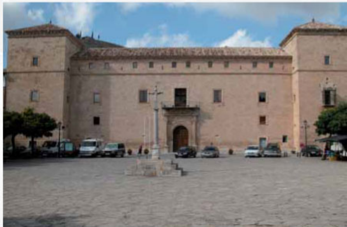
PALACIO DUCAL DE PASTRANA

Promotor: Universidad de Alcalá de Henares