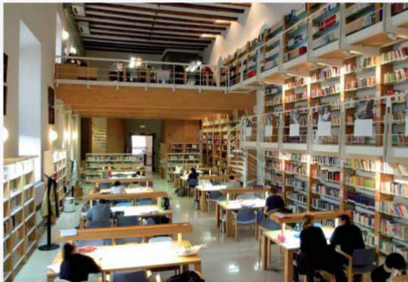
COLEGIO CARACCILO, Alcalá de Henares