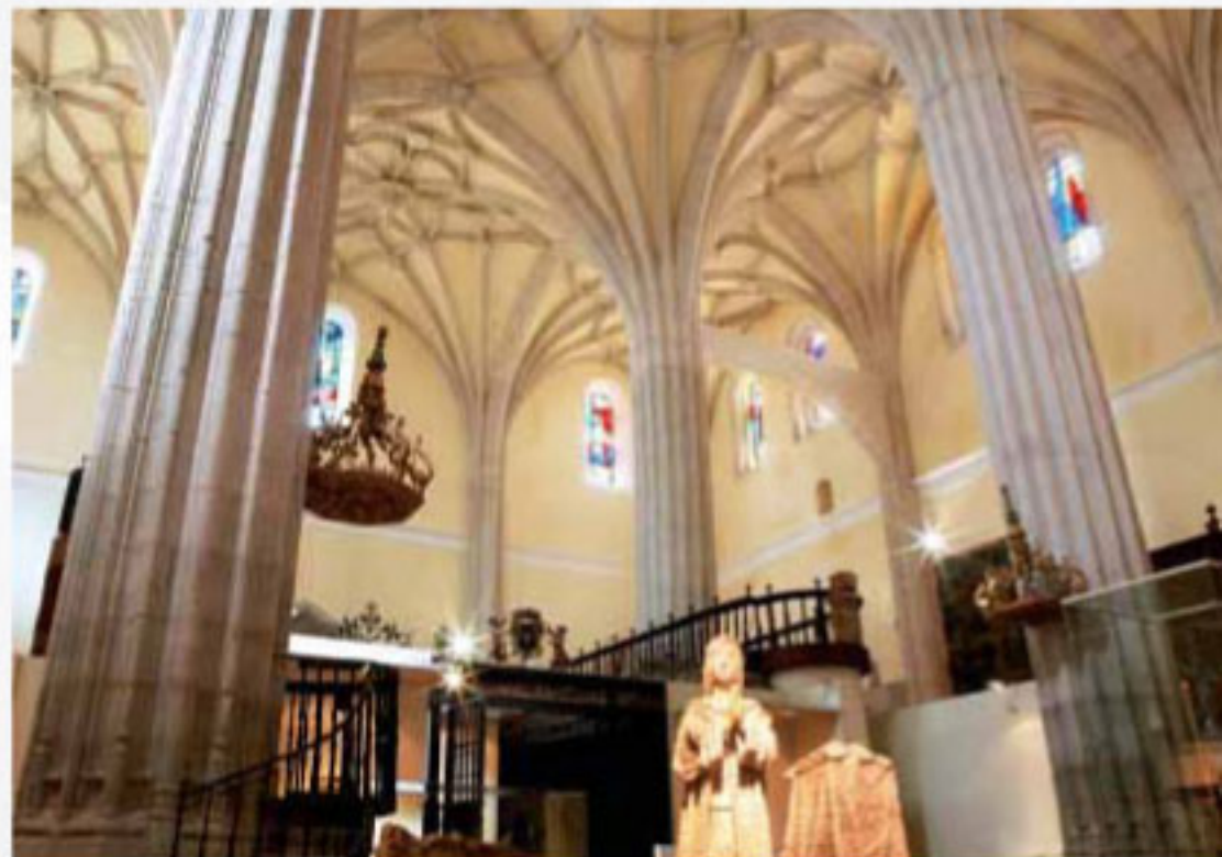
COLEGIATA MEDINA DEL CAMPO

Promotor: Fundación del Patrimonio Artístico de Castilla León