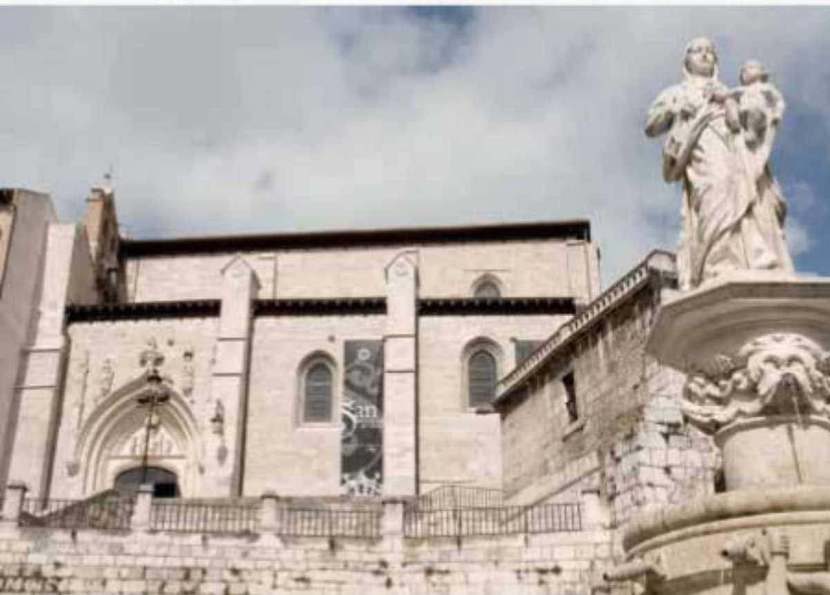
SAN NICOLAS DE BARI, Burgos