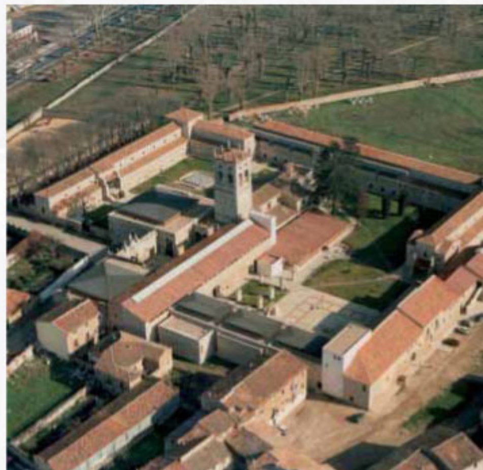
PALACIO DE LA ISLA , Burgos