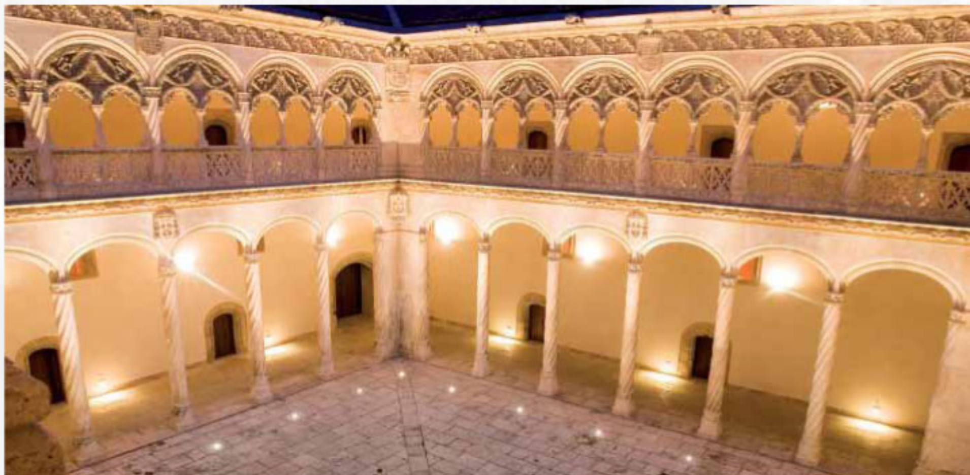
MUSEO NACIONAL DE ESCULTURA, Cadenas de San Gregorio, Valladolid