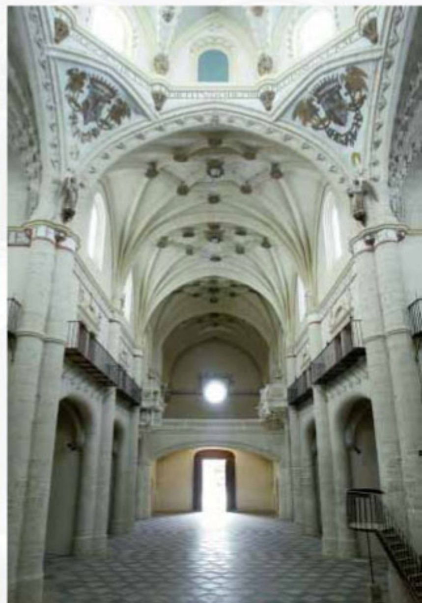
IGLESIA DE SAN FRANCISCO, Medina de Rioseco