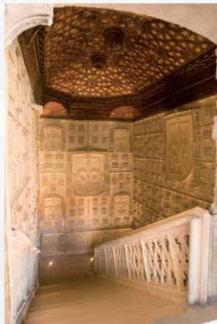
MUSEO NACIONAL DE ESCULTURA, Cadenas de San Gregorio, Valladolid