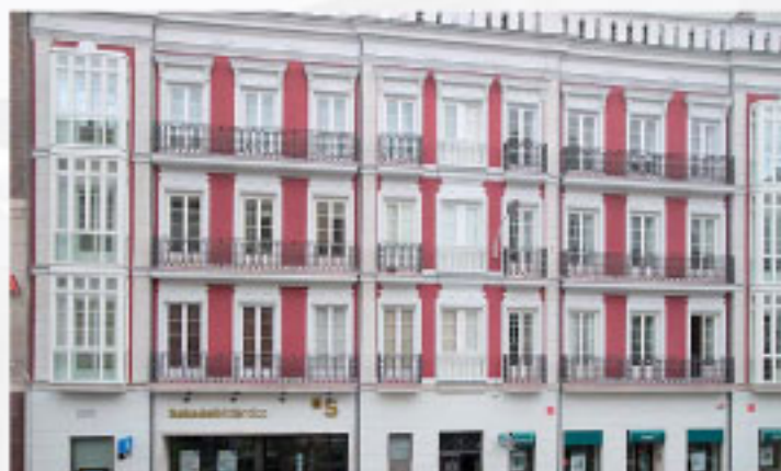
EDIFICIO MIGUEL ISCAR