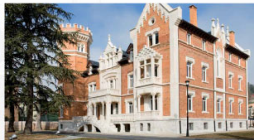
PALACIO DE LA ISLA