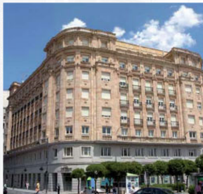
EDIFICIO CAJA DUERO