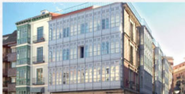
EDIFICIO DEL VAL